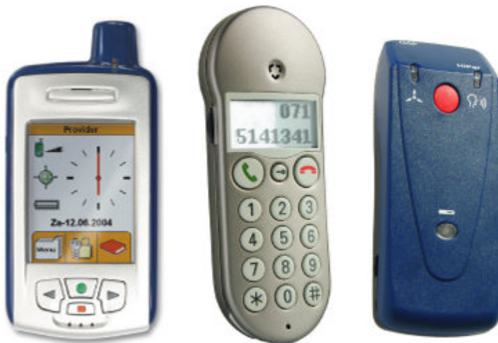
De zeer functionele Secufone, Simplephone en Carefoon

Inkoopcombinatie Yiggers ( http://www.yiggers.nl ) heeft de toestellen bij elkaar gezocht, en lanceert in samenwerking met de Unie KBO de website http://www.mijntoestel.nl . Op deze website zijn de 8 senior-vriendelijke mobieltjes te vinden en te bestellen. De website helpt bij het maken van een keuze tussen deze toestellen. De belangrijkste functies kunt u daar bekijken en vergelijken. Ook laat de website zien wat een toestel echt kost.