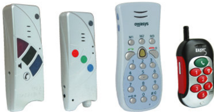
Mobi-Click Compact I en II, Owaysys 112C en de zeer voordelige Easy5

Maar Yiggers heeft nog meer ijzers in het vuur. Zo biedt het onder de naam 15-Plus Mobiel zeer voordelige mobiele telefonie, op het netwerk van Telfort. Dit kunt u direct meebestellen als u een toestel aanschaft. U belt daarmee bijvoorbeeld al vanaf 2 cent per minuut (in de daluren) naar alle vaste nummers in Nederland. Van dit aanbod kunt u alleen gebruik maken als u lid bent van de Unie KBO. Dat lidmaatschap staat open voor alle 50-plussers die in Nederland woonachtig zijn, en kost €18,50 per jaar. Het is een vorm van prepaid met automatische incasso.